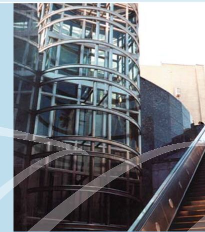
Sunset/Vermont Red Line Station